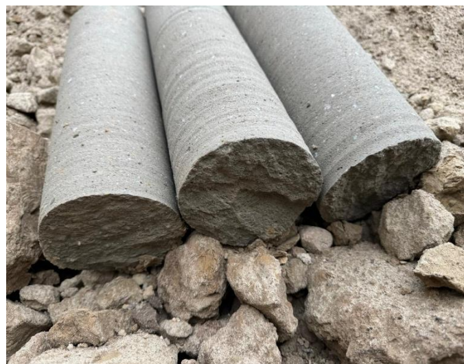
Грунтоцементные образцы (керны)

Одним из этапов контроля качества работ был отбор образцов (кернов) для проверки прочности грунтоцемента DSM.